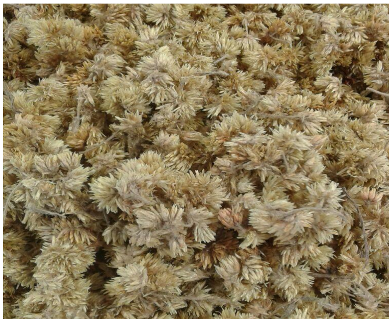
Figura 1 – Flores de Achyrocline satureioides .

Achyrocline satureioides (Lam.) D.C. (Figura 1), conhecida popularmente como “macela ou macela do campo”, é uma planta nativa da América do Sul. Esta espécie cresce em todo o Brasil, com exceção da região Amazônica (TESKE; TRENTINI, 2001; CORREA, 1984).