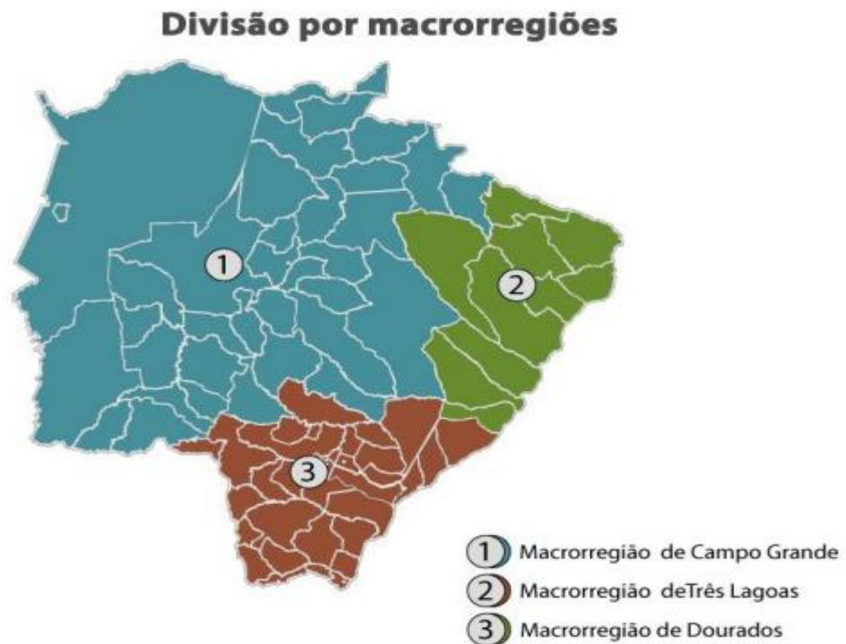
Figura 2: Distribuição das Regiões de Saúde de Mato Grosso do Sul, de acordo com a Resolução nº.075 /SES/MS, de 14 de outubro de 2.011, SES/MS, janeiro 2012.

Tozzetti e colaboradores apresentam resultado de dois estudos nas duas maiores cidades do estado, que buscou avaliar a frequência de genótipos de HPV em amostras cervicais na cidade de Campo Grande com achados: 11, 6, 16, 18, e 66 associando infecção por múltiplos genótipos. E em estudantes universitárias sexualmente ativas, na faixa etária de 18 a 35 anos, nos municípios de Dourados e Campo Grande, identificando com maior frequência os tipos virais HPV45 seguido pelo HPV16 e HPV31 (72) (73) . Em um estudo mais recente no ano de 2015 observou-se prevalência de HPV de 5,9% em mulheres atendidas na atenção básica de Dourados, com genótipos de HPV 52, 58, 70, 83 e 86 (74) .