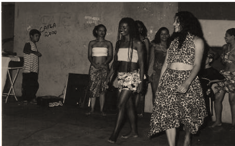
FIGURA 8. Desfile Multicultural, com ênfase na Beleza Negra.