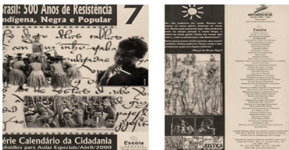
FIGURA 2. Caderno da Escola Guaicuru. Série Subsídios para Aulas Especiais.

Com uma temática cuidadosamente voltada para o combate ao racismo e a discriminação racial, o Caderno n.2 continha propostas de atividades para o Dia Nacional de Combate à Discriminação Racial. Especificamente, o Caderno n.7 destinava-se a orientar o corpo docente na preparação das aulas. Os conteúdos desse Caderno disponibilizaram materiais capazes de significar a histórica de resistência das etnias indígenas e negras no Brasil, e trazia como pano de fundo o mote dos 500 anos da nação brasileira. O Caderno constituía-se numa verdadeira fonte de sugestões de atividades pedagógicas (FIGURAS 2 e 3).