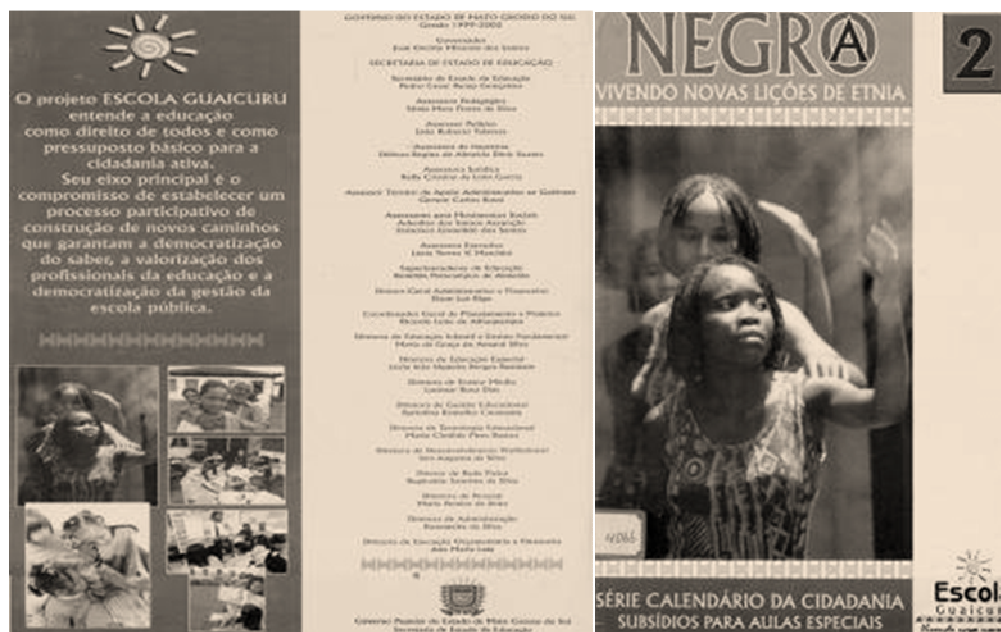
FIGURA 3. Caderno da Escola Guaicuru. Série Subsídios para Aulas Especiais.

A implantação de políticas afirmativas focadas na educação e no trabalho alcançou Mato Grosso do Sul e intensificou-se a partir dos Planos Estaduais de Educação do Governo de José Orcírio Miranda dos Santos (Zeca do PT), por meio dos Projetos “Escola Guaicuru: vivendo uma nova lição” - gestão 1999-2002, e do Projeto “Escola Inclusiva: espaço de cidadania” - gestão 2003-2006.