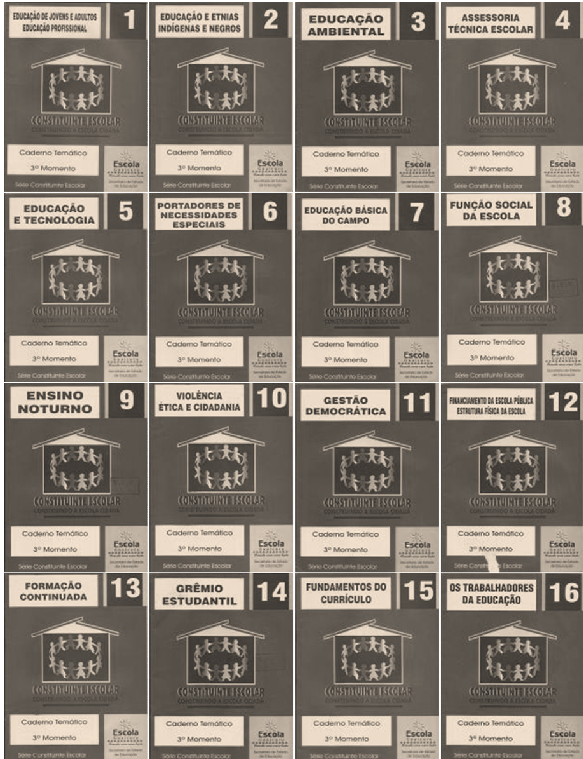
FIGURA 1. Cadernos da série Constituinte Escolar. Cadernos da Escola Guaicuru.

Tendo em vista o processo acima descrito, a gestão do Governo em questão entendeu a importância de se construir um modelo de gestão democrática. Nesse contexto, torna-se essencial perceber de que forma a mesma procurou materializar sua ideologia, e, nesse sentido, seguem abaixo alguns Cadernos da denominada Escola Guaicuru (FIGURA 1).