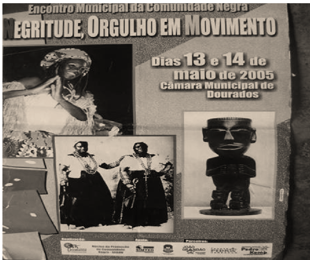
FIGURA 7. Cartaz retrata o Encontro Municipal da Comunidade Negra, denominado Negritude.