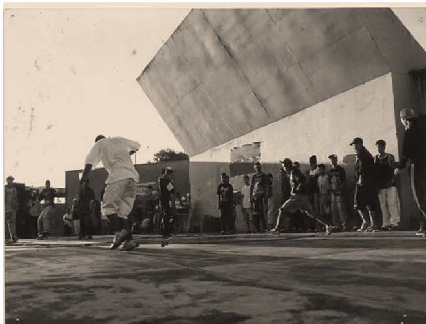
FIGURA 9. Atividade Cultural na Praça do Cinquentenário de Dourados com grupos de Hip Hop, Rap e Capoeiristas.