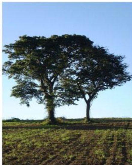
FIGURA 1. Árvores de copaiba ( Copaifera langsdorffii )

As copaibeiras (Figura 1) são árvores comuns à América Latina e África Ocidental (Francisco, 2005), sendo encontradas no Brasil, nas regiões Sudeste, Centro-Oeste e Amazônica. Essas plantas podem viver cerca de 400 anos, atingindo uma altura entre 25 e 40 metros (Araújo Júnior et al., 2005), diâmetro entre 0,4 e 4 metros, possuem casca aromática, folhagem densa, flores pequenas e frutos secos, do tipo vagem. As sementes são pretas e ovóides com um arilo amarelo rico em lipídeos (Alencar, 1982; Van Den Berg, 1982; Lorenzi, 1992; Xena & Berry, 1998).