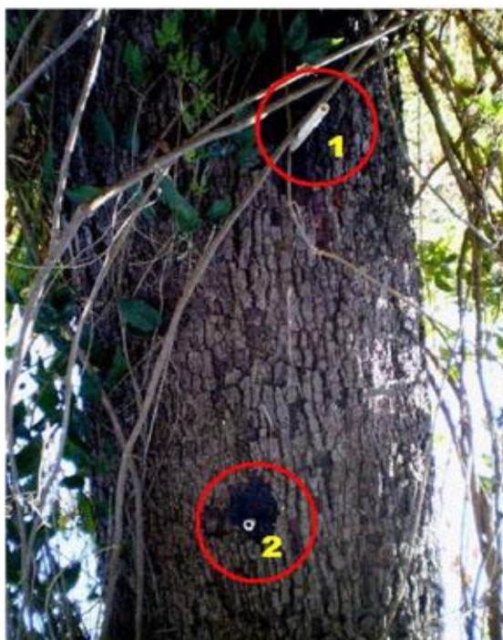
FIGURA 2. Extração do óleo de copaíba. O óleo escoar pelo orifício 2, quando ambos estão desobstruídos. Ao selar a abertura do orifício 1, cessa-se o escoamento do óleo.

(Alencar, 1982; Veiga Junior & Pinto, 2002; Oliveira et al. 2006; Ramos, 2006; Rigamonte-Azevedo et al., 2006). Coloca-se um cano de PVC de \frac{3}{4} de polegada aonde foi perfurado, por onde o óleo escorre, e se reserva o óleo. Depois do término da extração, o orifício é tampado para proteção contra fungos e cupins (Oliveira et al., 2006; Ramos, 2006; Rigamonte-Azevedo et al., 2006) utilizando-se argila (Ramos, 2006) ou tampa de plástico que possa vedar (Oliveira et al., 2004) sendo as duas formas de retirada facilitada para as próximas colheitas de óleo com maior facilidade de manipulação (Oliveira et al., 2006; Ramos, 2006).