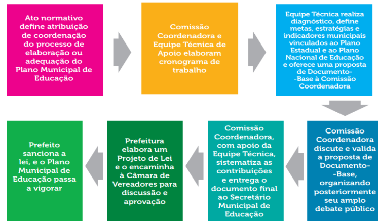
Grafico 1: Organização de atividades para elaboração e adequação do PME segundo a plataforma SASE