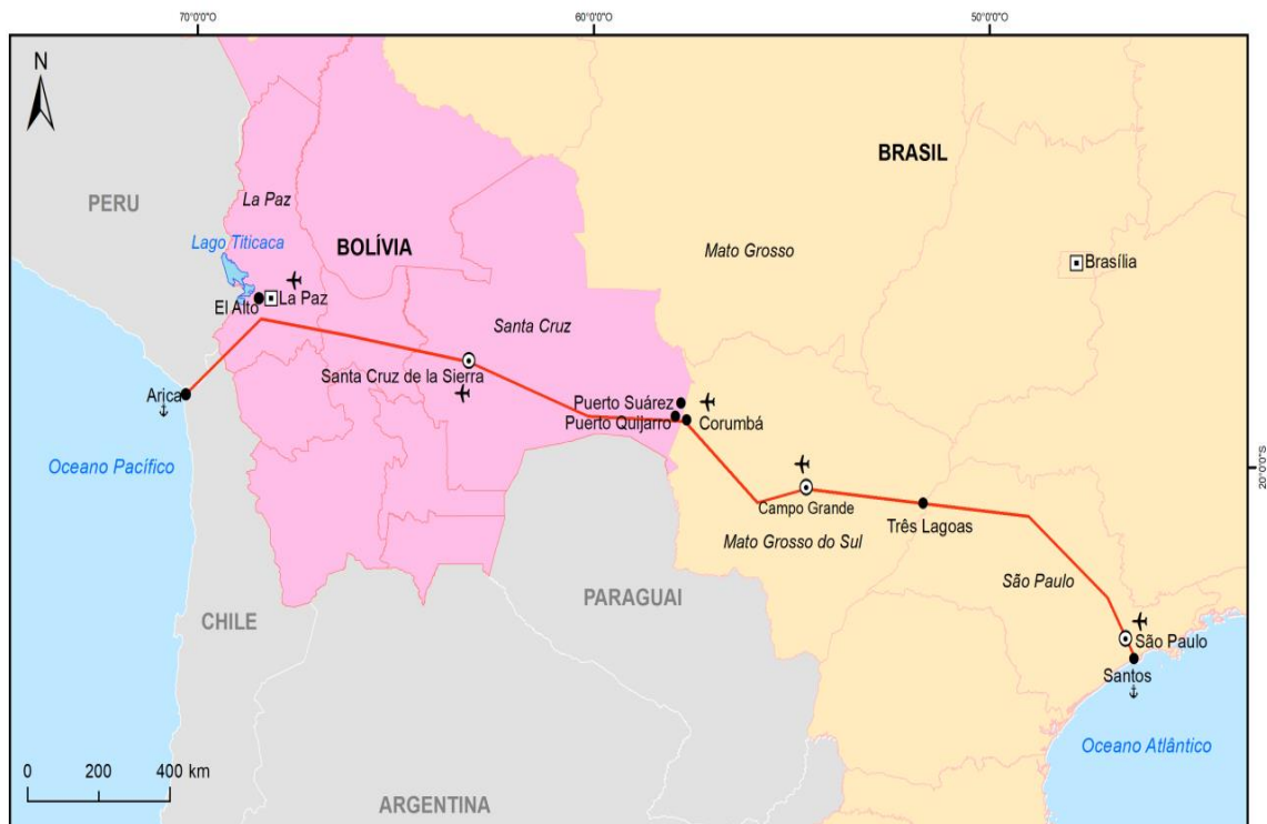
Mapa 1 – Fronteira Brasil-Bolívia

Segundo informações extraídas da Pesquisa ENAFRON 36 (2012), Mato Grosso do Sul é considerado um estado de trânsito, pois suas fronteiras com a Bolívia e com o Paraguai são porta de entrada para o Brasil inteiro. A rota Puerto Quijarro (BO) /Corumbá (MS) – Campo Grande (MS) – São Paulo é uma das mais conhecidas e de maior fluxo para a entrada no país (Mapa 1).