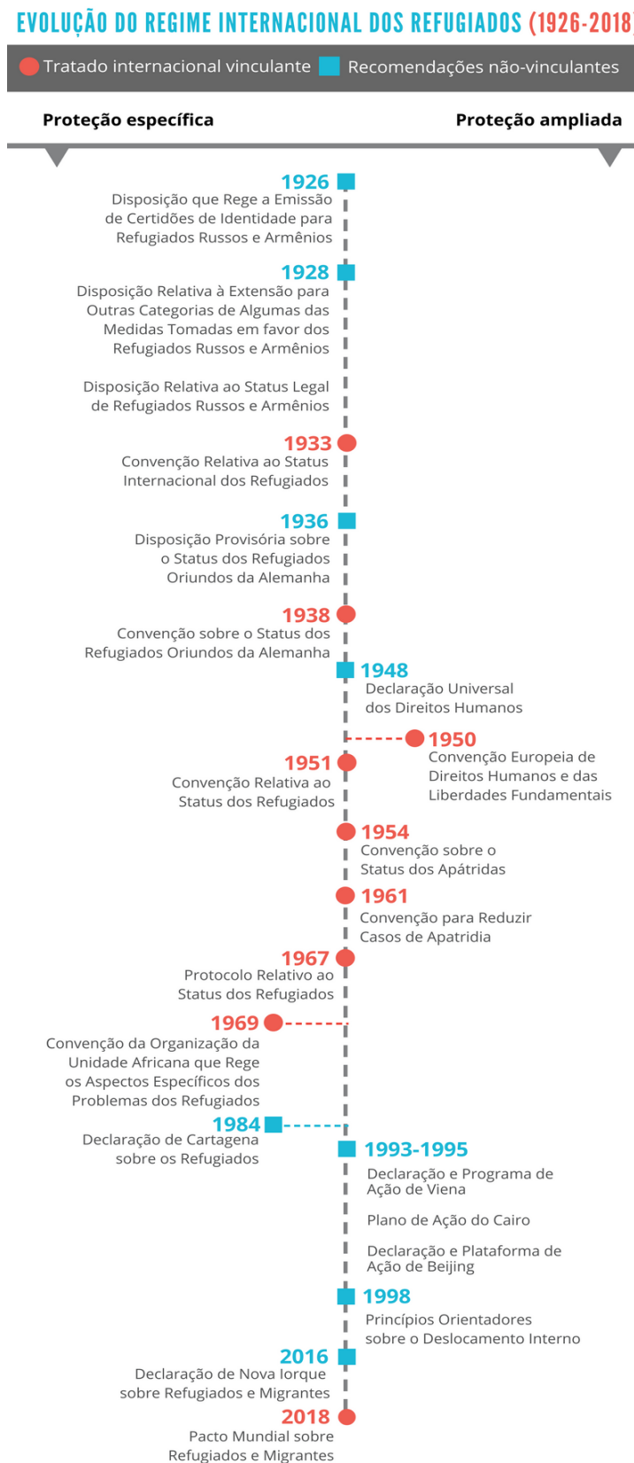
Figura 1 – Evolução do Regime Internacional dos Refugiados (1926-2018)