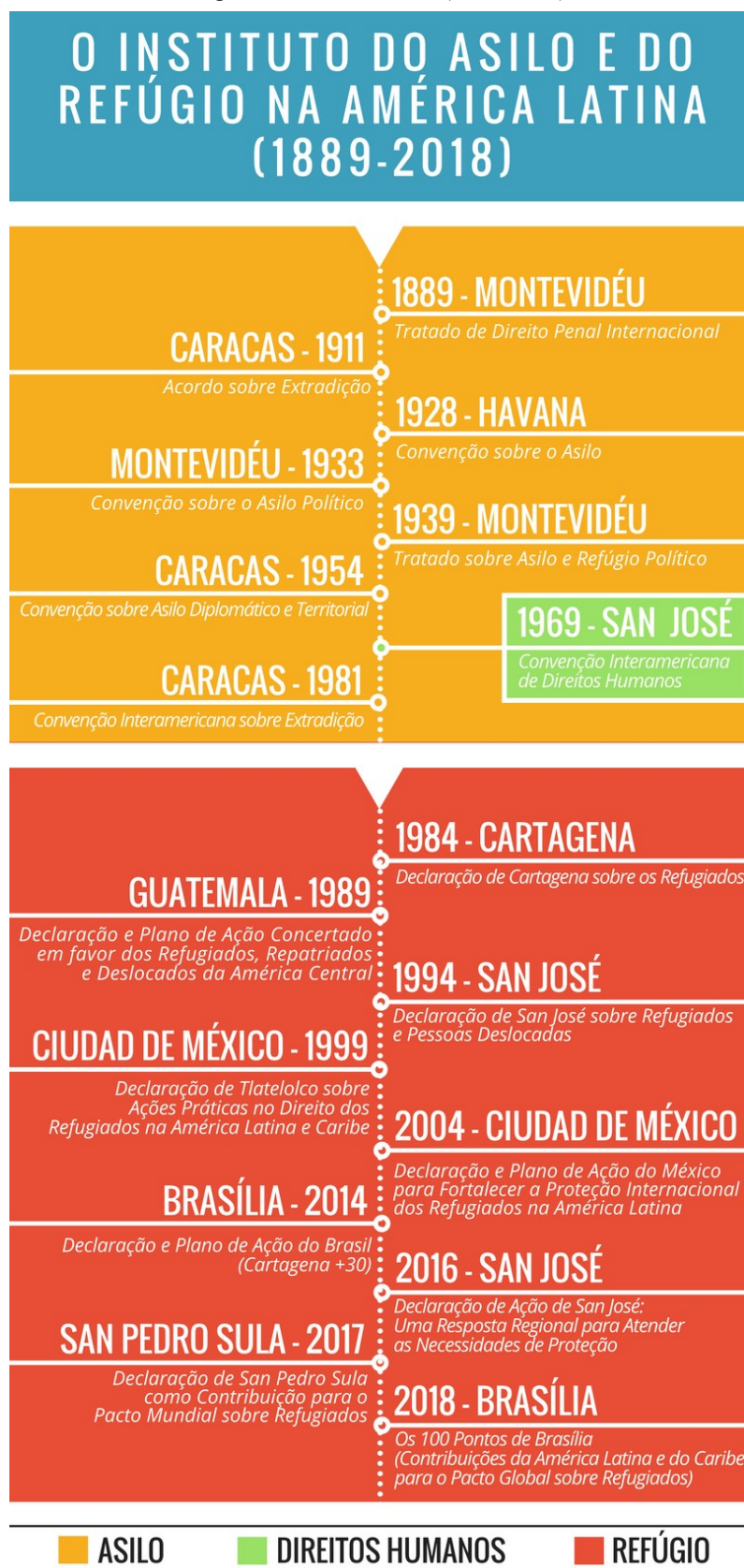
Figura 2 – O instituto do asilo e do refúgio na América Latina (1889-2018)